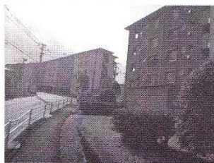
福岡市東区稲佐山地域