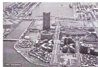
福岡市東区照室地域

2030年代の日本はどういう社会になっているか。人口が1割ほど減る。働く世代が2割減る。子どもは増えない。高齢者が3割ほど増える。そういう社会を今のままのしくみで乗り切るとはむずかしい。対応策として、わがこととして「おたがいさま」で解決していく支援技術の開発がねらいです。実証フィールドは福岡市。三つの地域を選びました。「郊外の住宅団地」。次の時代のコミュニティの主人公として病院、学校などを取り込む。「集合住宅」。新しい住民の声を「コミュニティ・カフェ」でとらえる。新しい「アイランドシティ」。健康未来都市のコンセプトで運動を展開。さらには取り組みを支援する「中間支援機能」をもつ組織づくりを、行政、事業所とフォーラムを形成してすすめます。