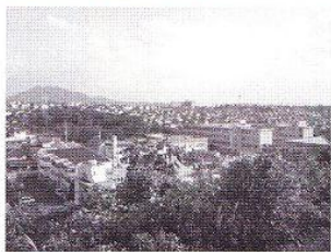
福岡市東区美和台地域